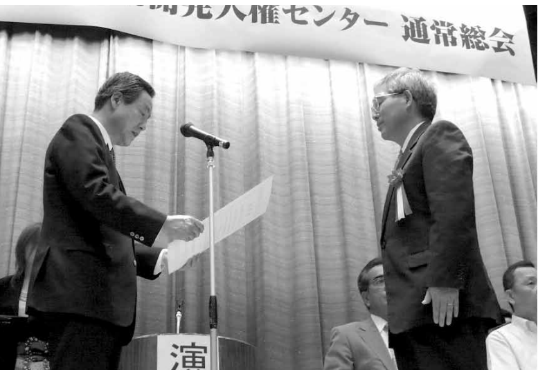
大阪府市谷労働政策監からの感謝状の贈呈

その後事務局から約1時間にわたる報告書の説明があり質疑応答のあと議長提案のおり次回に討議することを確認し終了しました。