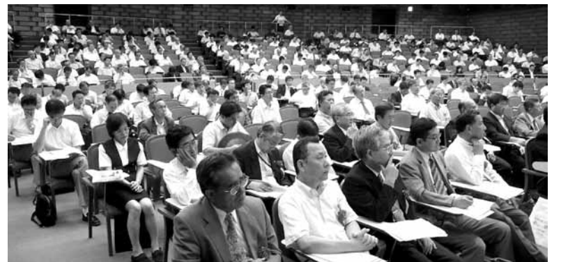
2008年通常総会 来賓者一覧表