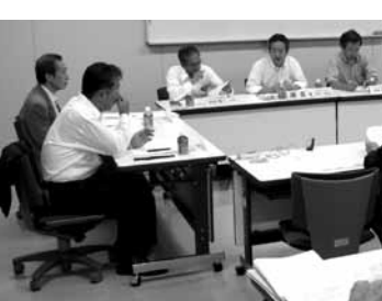
第3回検討委員会は10月15日(水)に開催予定です。