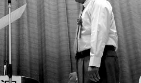
大阪市民局長からの感謝状の贈呈

労働部長・大阪市民局長の感謝状が贈呈されました。各部門ごとに受賞会員が紹介された場でも起立していただき、参加者全員から盛大な拍手で祝福を受け贈呈式は終了しました。