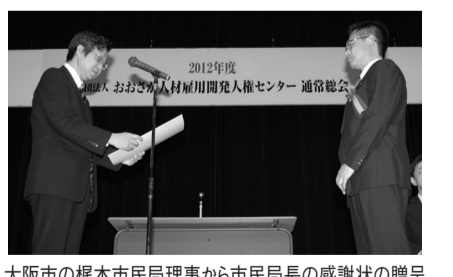
大阪市の梶本市民局理事から市民局長の感謝状の贈呈

04期は、2010年3月に検討委員会を設置し、評価期間を1年間とするにも感謝状は、就職マッチング賞、人材開発・養成貢献賞、会員貢献賞を設けることにし2011年度通常総会で表彰しました。