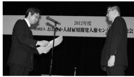
大阪市の梶本市民局理事から大阪市長の感謝状の贈呈