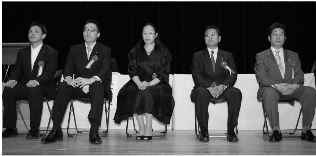
感謝状受領代表会員

2012年度通常総会で第5期「会員貢献度評価顕彰制度」に基づき決定された会員を顕彰するため、就職マッチング賞には大阪府知事・大阪市市長から、人材開発養成貢献賞には大阪府商工労働部長・大阪市市民局長から、会員貢献賞にはC-STEP松本理事長から感謝状の贈呈が行われました。