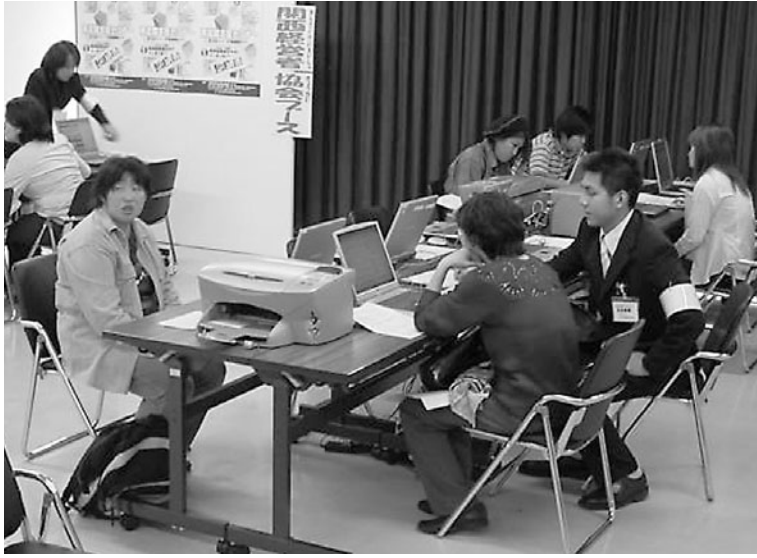
ハローワーク・インターネットサービス「求人情報検索」

大阪市では、平成17年度までに早急に取り組み施策・事業をまとめた「大阪市雇用施策推進プラン(基本計画)」