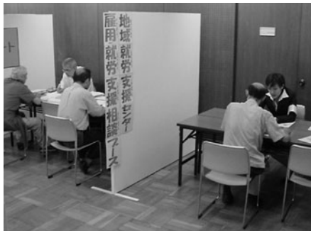
コーディネーターによる雇用・就労支援相談

来場者のアンケートでは、各種相談コーナーや職業適性診断コーナー、パソコンによる求人情報の提供、公共職業安定所の求人紹介などが満足されているといった結果がでています。また、今後、必要な支援としては、就職に関するじっくりとした相談との声が多くありました。