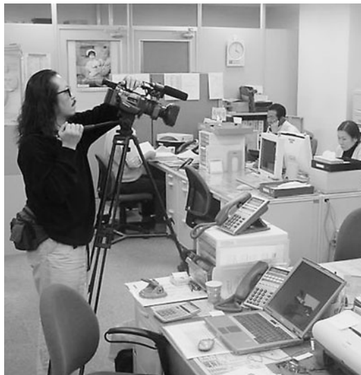
ビデオ撮影の様子

地域就労支援事業を多くの会員・関係者のみなさまにご理解、ご協力いただくため、2002年12月に「地域就労支援事業推進協議会・大阪府・大阪市・C-STEP」の企画・制作による啓発ビデオを会員の皆さまに配布させていただきました。今回は、その第2弾として、C-STEPの人材開発養成事業の柱である「人材スキルアップコース」に挑戦した受講生を主役に、就職にマッチングするまでをビデオ化する予定です。ビデオは、約15分間、完成は来年度1月の予定です。